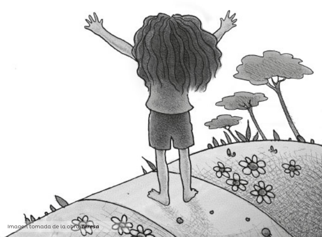
Imagen tomada de la obra Teresa