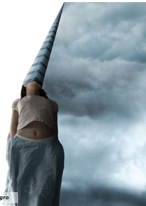
Fear of the shark detalle de la cubierta La laguna del Cristo Negro

Stefano Bonazzi es un artista de origen italiano; diseñador gráfico, fotógrafo y escritor. Sus obras gráficas se caracterizan por un fuerte componente fotográfico que interviene digitalmente hasta alcanzar propuestas artísticas que subyugan. Fear of the shark es el título de la obra que se muestra en la cubierta de La laguna del Cristo Negro . Anteriormente, su obra The girl fue imagen de la cubierta de la obra El fantasma de la Caballero , también de Norberto José Olivari.