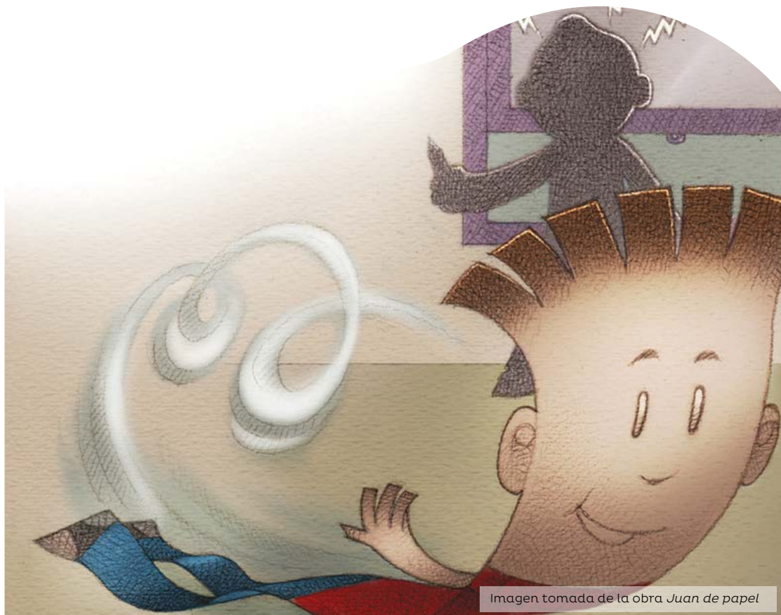
Imagen tomada de la obra Juan de papel