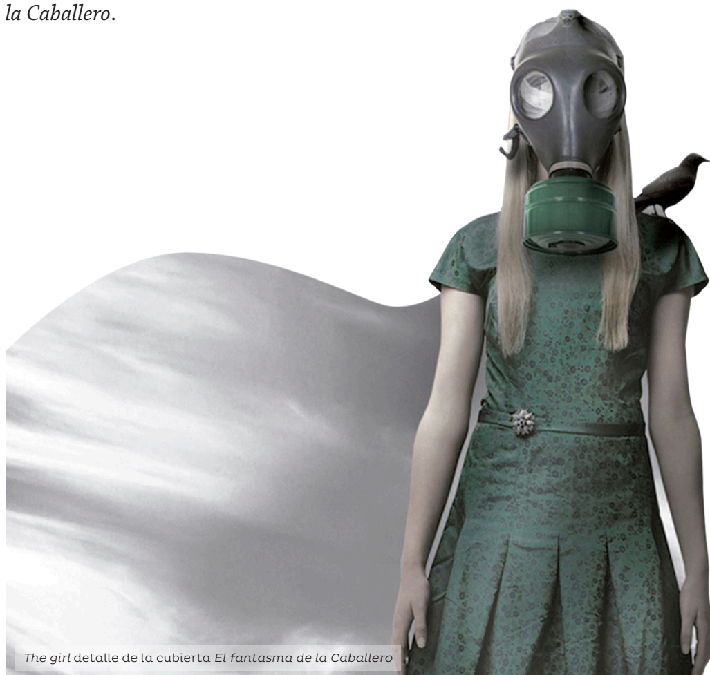
The girl detalle de la cubierta El fantasma de la Caballero

Stefano Bonazzi es un artista de origen italiano. Diseñador gráfico, fotógrafo y escritor. Sus obras gráficas se caracterizan por un fuerte componente fotográfico que interviene digitalmente hasta alcanzar propuestas artísticas que subyugan. The girl es el título de la obra que se muestra en la cubierta de El fantasma de la Caballero .