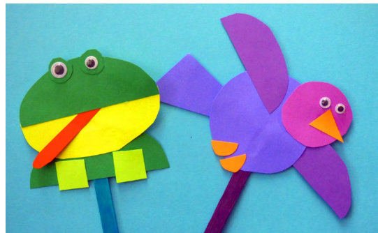
Pueden acceder al video con las instrucciones en la web: pbsocial.org .