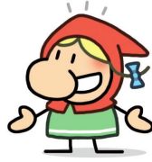
Caperucita (que se cree otro cerdito)