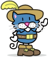
Gato con Botas