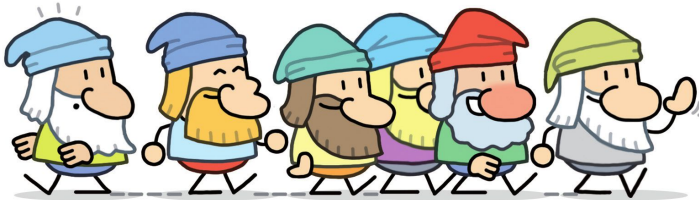
Los seis enanitos