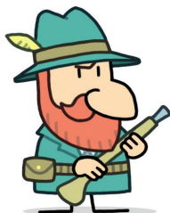
Cazador (que se cree el cerdito listo)