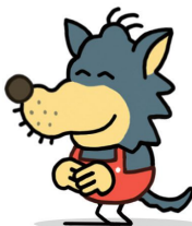
Otro lobo (que se cree la abuelita de Caperucita)