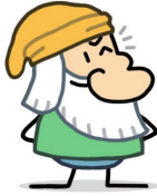
Gruñón (que se cree la Bella Durmiente)