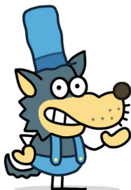
Lobo de los tres cerditos

(en negrita los personajes que hacen de ellos mismos)