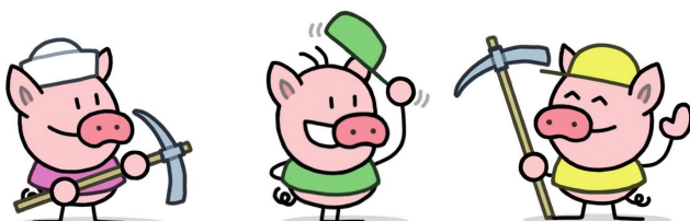
Los tres cerditos (que se creen los siete enanitos)