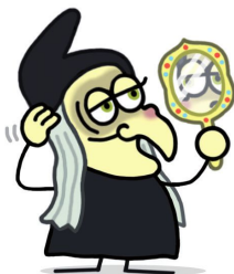
Madrastra disfrazada de bruja