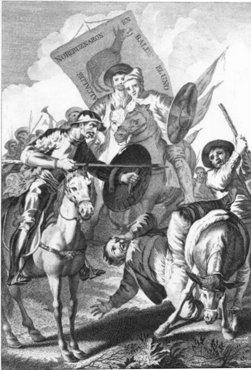
Estampa de Francisco de Goya finalmente descartada para ilustrar el Quijote académico de 1780.