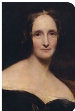
Retrato de Richard Rothwell