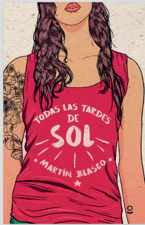
ILUSTRACIÓN DE CUBIERTA: