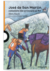
Adela Basch José de San Martín caballero del principio al fin Ilustraciones: Viviana Garófoli Género: Teatro Temas: Historia, Humor

Una obra de teatro que recorre episodios de la vida de una de las figuras más importantes de la historia argentina. Los valores, los ideales y el compromiso con la libertad y la independencia de los pueblos americanos que marcaron la vida del general San Martín se entremezclan con los problemas de cualquier persona de carne y hueso con sentimientos, dudas y pesadillas.