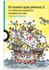
Esteban Valentino "Por allí no hay paso, General" en El mono que piensa 2 Ilustraciones: Tabaré Género: Cuento Temas: Historia

Según el autor del cuento, Esteban Valentino, antes que el Padre de la Patria, el gran jinete sobre su caballo blanco, la estatua de las plazas, San Martín debió de haber sido un flor de tipo. Las historias como la que se narra en el cuento lo vuelven de dimensiones humanas y hacen aún más valiosos sus esfuerzos y sacrificios.