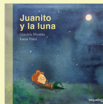
ILUSTRACIONES: Lucía Vidal