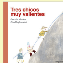
ILUSTRACIONES: Clau Degliuomini