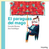
ILUSTRACIONES: Ana Sanfelippo