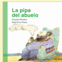
ILUSTRACIONES: Saúl Oscar Rojas