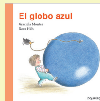
ILUSTRACIONES: Nora Hilb